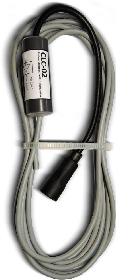
Bezeichnung: CLC-02 Redox/ORP Stromschleifen Konverter Bestellnummer: 10.40.2113